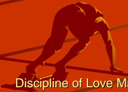
Discipline of Love Matrix